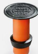
T 05M - 1,5 t teleskop z manszetą 3496100517