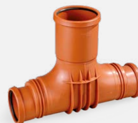
kineta przelotowa 110 / 200 3496100534 160 / 200 3496100535 200 / 200 3496100603