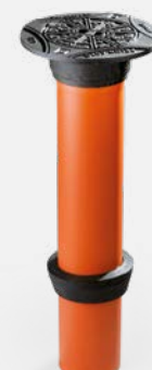
T20 - 40t teleskop z manszetą rura zintegrowana z korpusem 3496100518